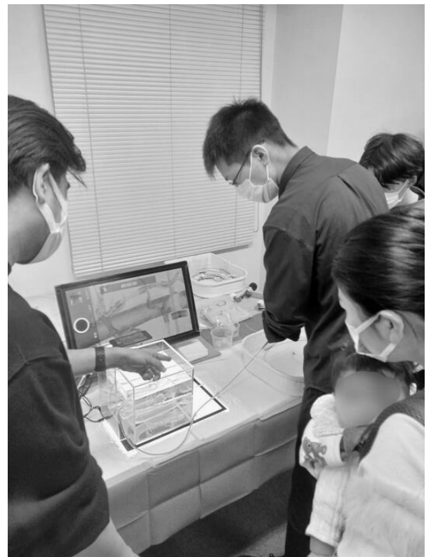
図 2. 模擬シュミレーターを用いた PCI ハンズオントレーニングの様子 (2023/2/18 : 京都にて)