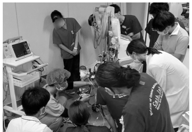
図 4. PCPS (補助循環) のハンズオントレーニング (2023 年秋 : 京大カテ室にて)